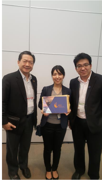
ภารกิจที่ 3: หาหรือแนวทางการพัฒนาบุคลากรเพื่อรองรับอุตสาหกรรมในประเทศไทย กับ BOI และนักลงทุน